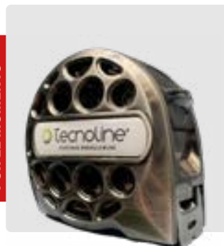
Flexometro 7.5 m